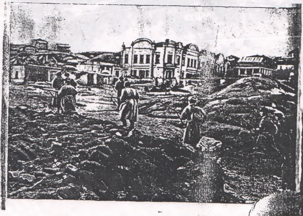
Такой увидели станицу Цимлянскую наши освободители.